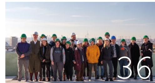
Hildegarden e. V.